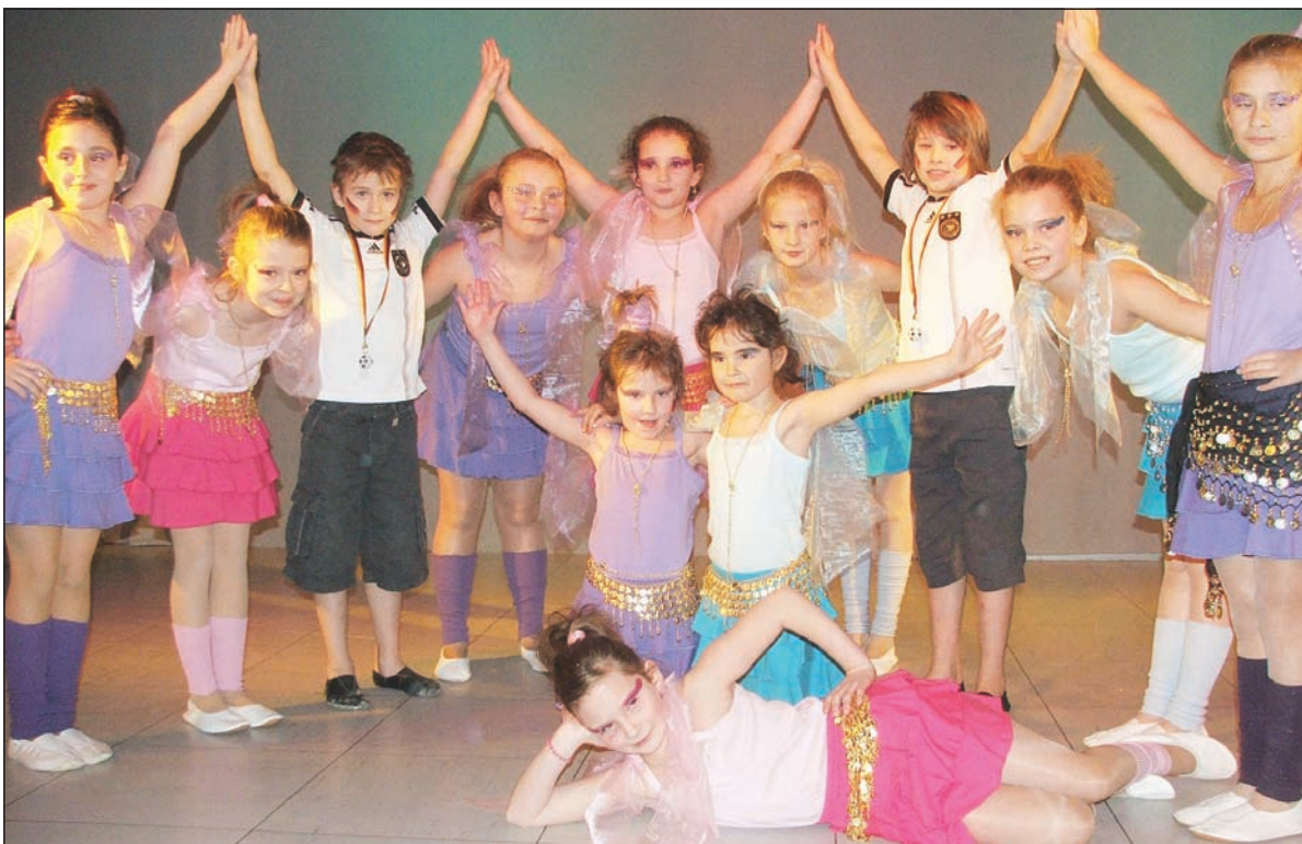
Die temperamentvollen StephKids eröffneten den Ballettreigen.