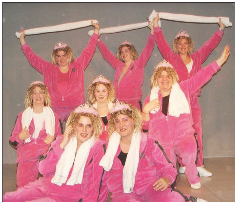
Einer der Knüller der Stephanshäuser Fastnacht: Acht Mal Cindy aus Marzahn.