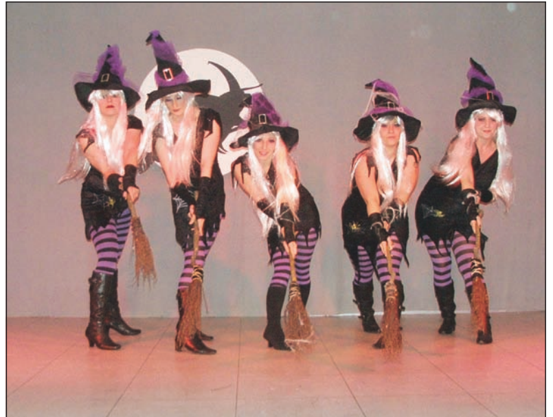
Sexy und verhext war die Tanznummer der „Funky Diamonds“.