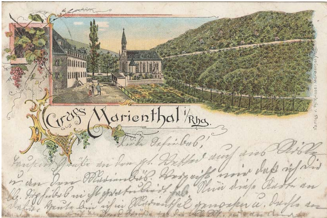
Ansichtskarte von Philipp Krissel aus dem Jahr 1898.